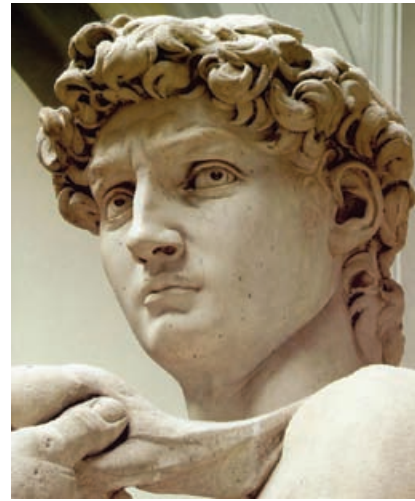
Miért néz így? Michelangelo: Dávid (1504)

Szóval gondolják meg, kedves Szülők, lehet még csatlakozni!