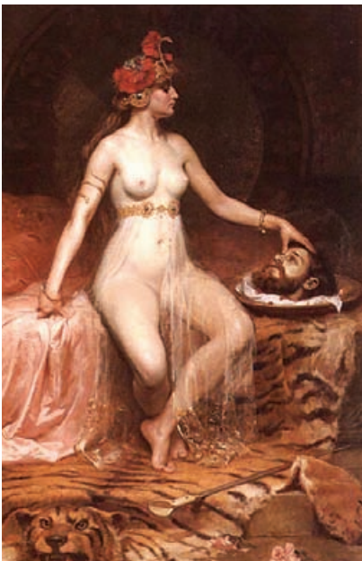
Minek neki egy levágott fej??? Pierre Bonnard: Salome (1865)

Végül íme néhány bibliai eredetű mondás. Ön hánynak ismeri az eredetét?