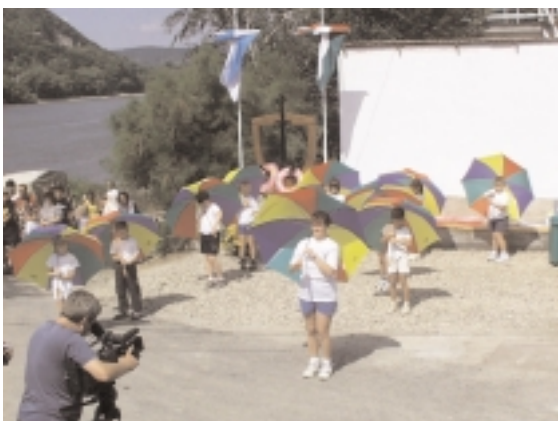
A kisoroszi iskolások műsora