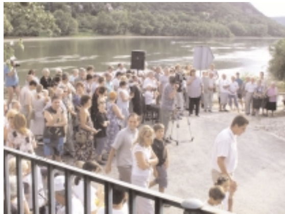
Az avató ünnepség közönsége