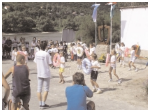
A kisoroszi iskolások műsora