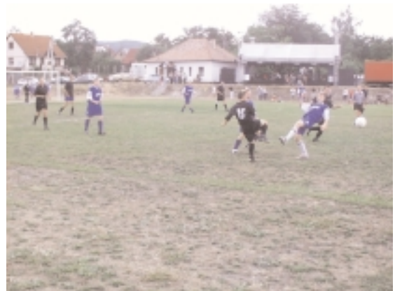
SZIGET válogatott - Vác labdarúgó mérkőzés