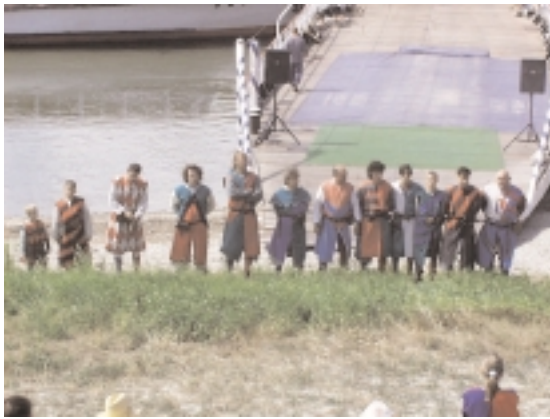
A visegrádi Szent-György Lovagok bemutatója