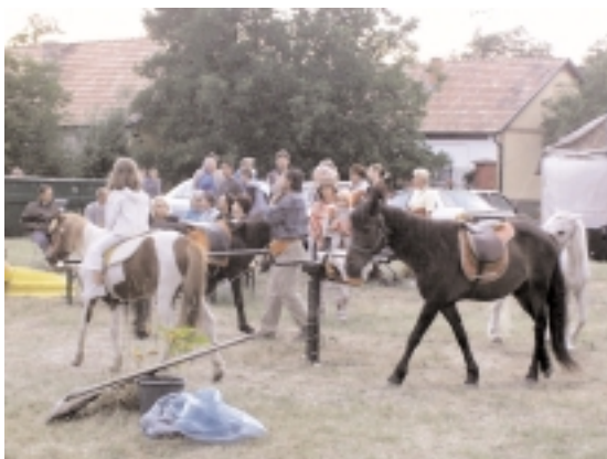
Pónilovaglás a főtéren