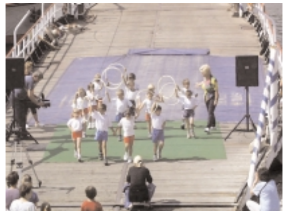
A kisoroszi óvodások műsora