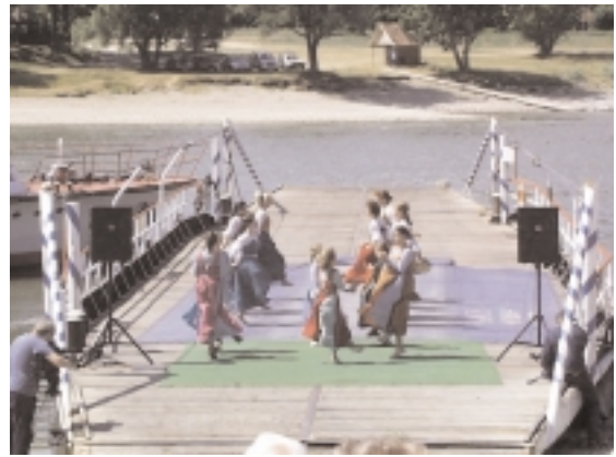
A visegrádi Reneszánsz Női tánckar műsora