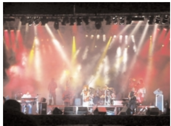
Demjén Ferenc koncert