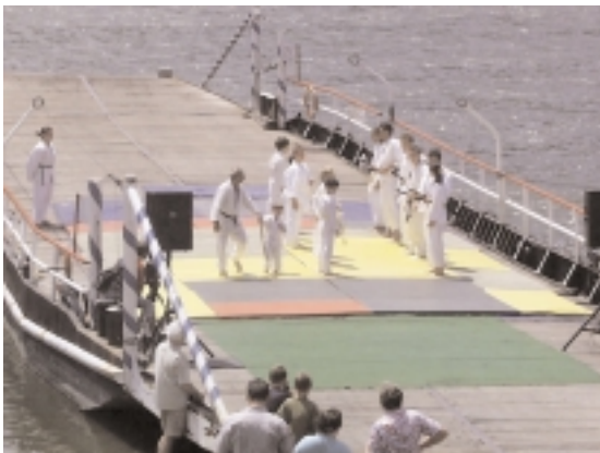
A kisoroszi judo és kungfu bemutató