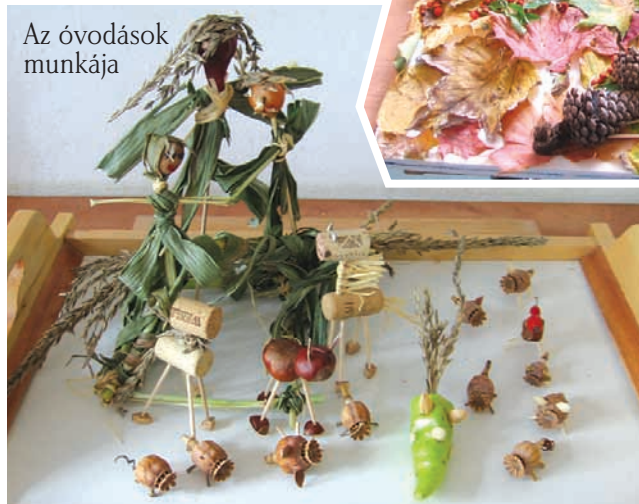
Az óvodások munkája