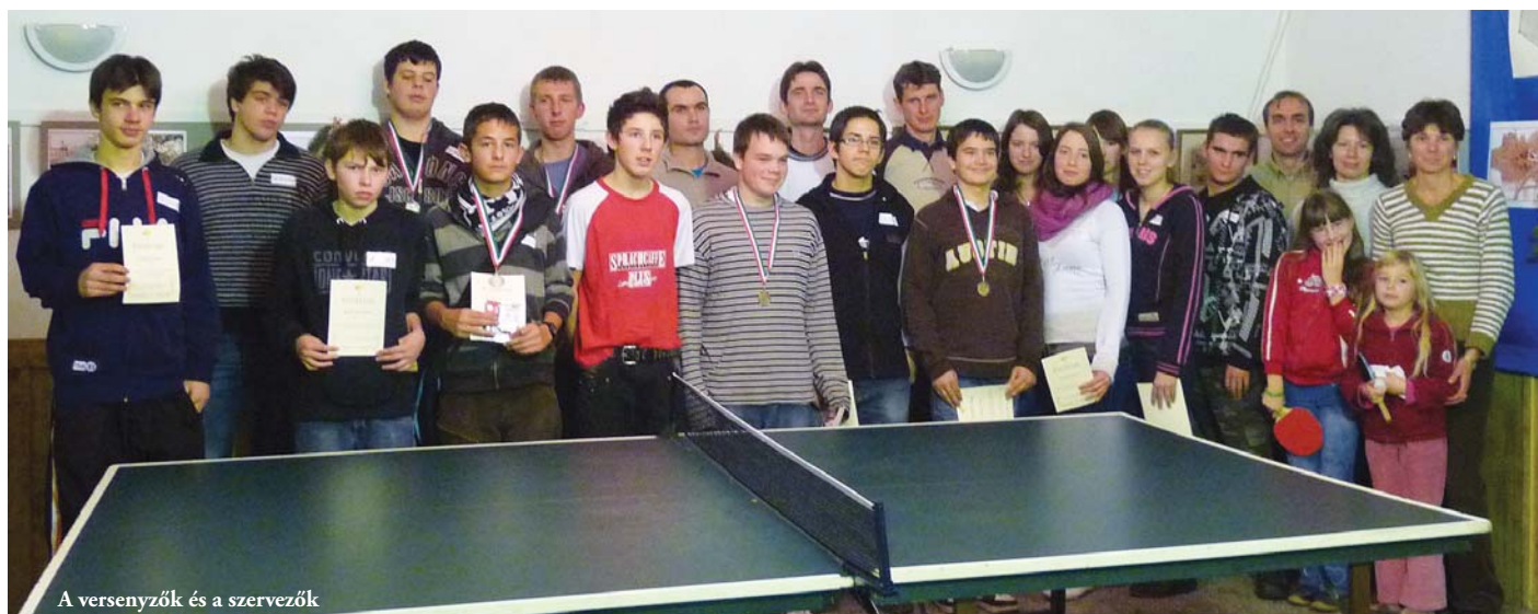
A versenyzők és a szervezők