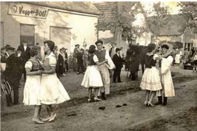
Vidám csárdás a kisoroszi bolt előtt, trágyakupacok között