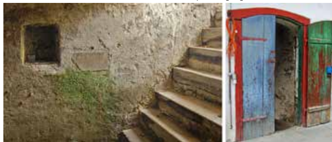
Egy 1838-as évszámtáblával jelölt kisoroszi pincejáró a főutcán

Ez a mezítlás kamasz az ökrös szekerekkel és a két nagy fahordóval úton van hazafelé, hogy a présbe tegyék a szőlőt. Kisoroszi-ban már csak egyetlen hatalmas, több mint 100 éves (muzeális védettségbe illő), tölgyfából ácsolt óriási présszerkezet található, de a régi dongaboltozatos pincék még ma is megvannak, ahol egykor az érett tölgyfahordók sorakoztak.