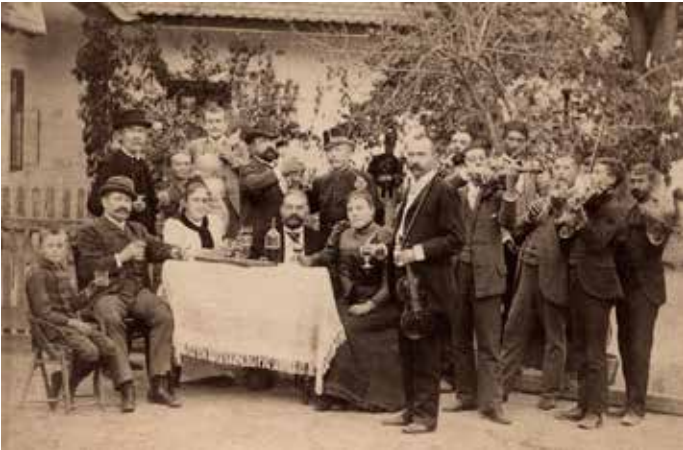
Szüreti multság Kisorosziban cigányzenekarral 1898-ban