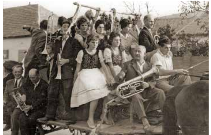
Szüreti felvonulás lovaskocsin, taposóhordóban állva az 1960-as években