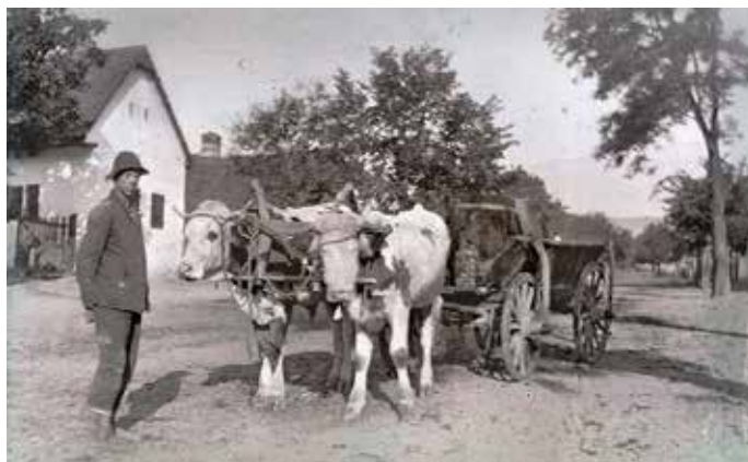
Szőlőszállító kisoroszi fiú az 1930-as évekből

Aki megnézi Kisoroszi 1770-es osztrák birtoktérképét, meglepetten láthatja, hogy az egy utcányi kis falucska óriási megművelt határral rendelkezett, melynek jelentős része szőlőültetvény volt. A mai Rév utcától a Hajós utcáig terjedő terület, de az egész Kálvária domb, a mai Pacsirta utca és a Szőlő utca (régiben „Csapás”) a Bárány köz és bármily hihetetlen: az egész mai üdülőövezeti rész a Homokalja, Fenyő és Akácfa utcáig óriási szőlőültetvényekkel volt tele.